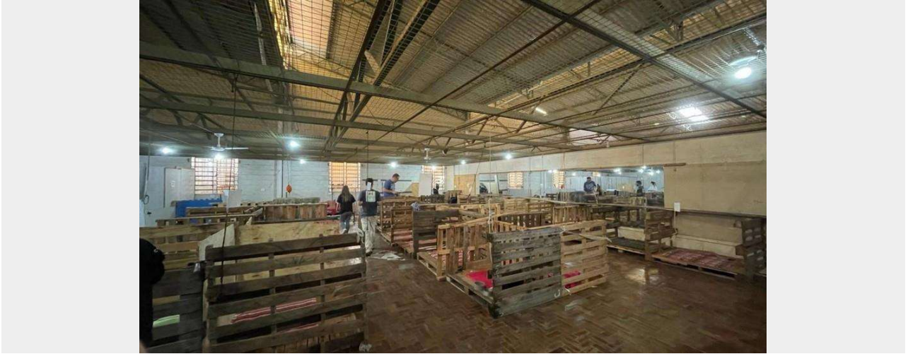
Voluntários realizam abrigos improvisados para animais no RS

e uma só para gatos. A gente está, inclusive, criando mais espaço para 50 gatos. Espero que a gente termine amanhã", diz.